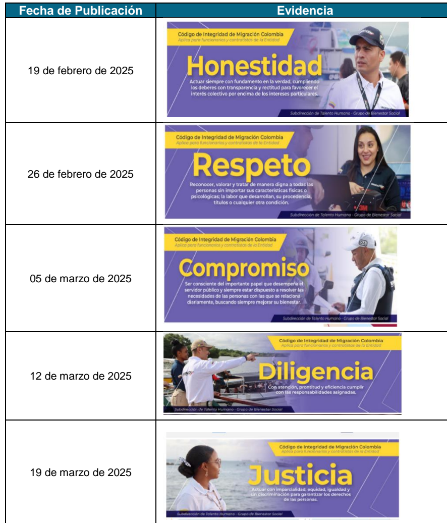
Tabla No 3 Publicaciones Ponte al Día I semestre de 2025.

impacto real de las actividades adelantadas por la Subdirección de Talento Humano, orientadas a fortalecer la Política de Integridad en el marco de la Dimensión Estratégica de Talento Humano del MIPG.