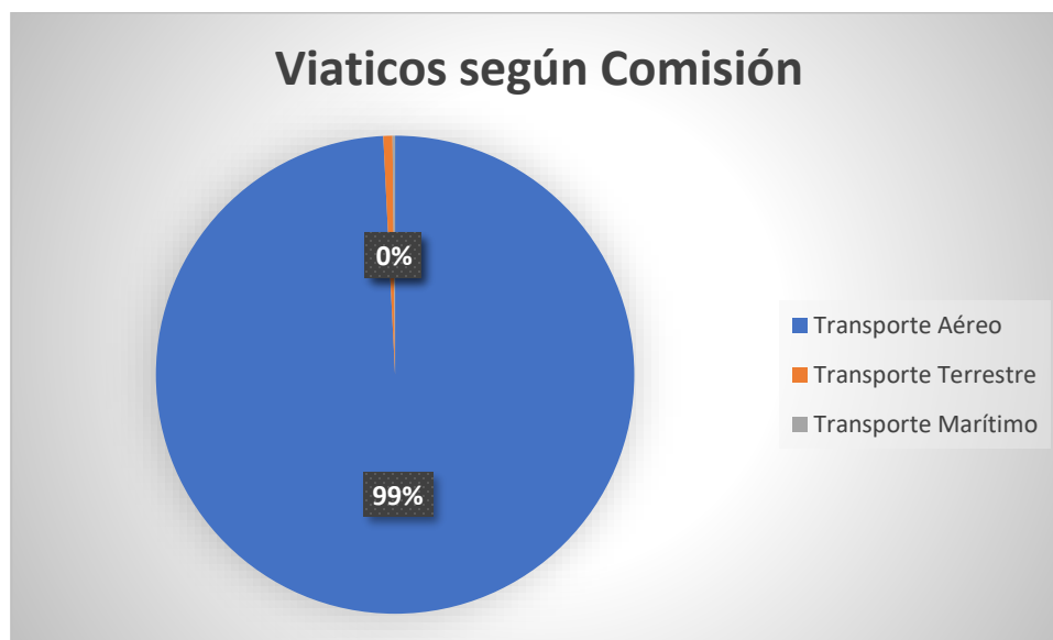
Gráfico No. 2 Viáticos según Comisión.

Las Comisiones por Transporte aéreo han ocasionado un mayor reconocimiento de viáticos a los funcionarios con un 99%. Como se detalla en el siguiente gráfico: