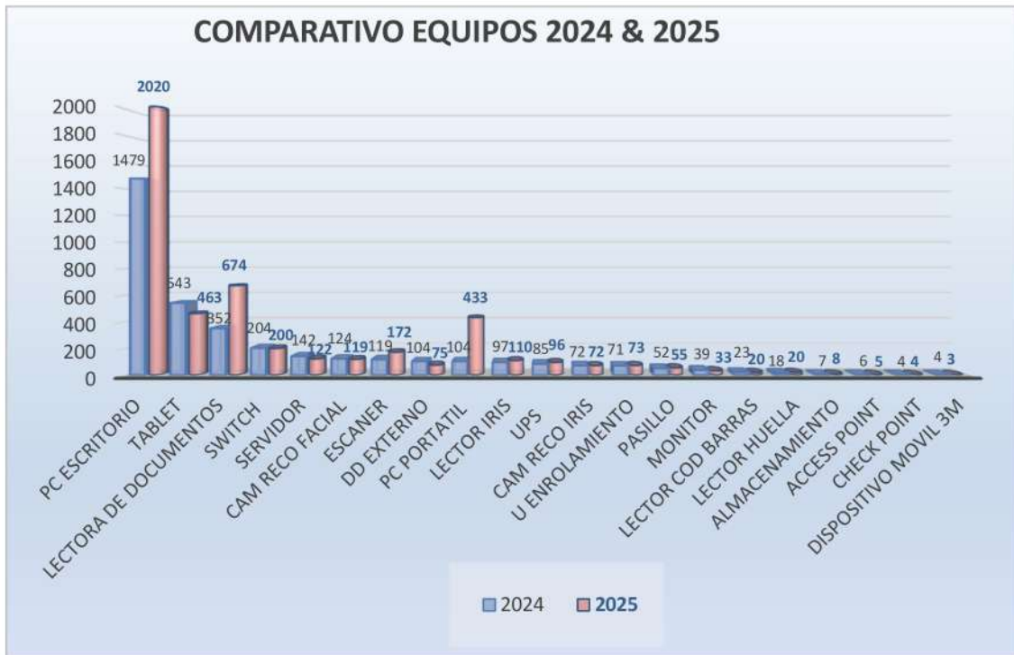
Gráfico: Comparativo equipos 2024 Vs 2025

Teniendo en cuenta los datos arrojados en la gráfica, se evidencia lo siguiente: