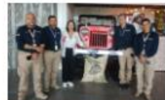
La regional Eje Cafetero recibió la visita de la directora general de la entidad