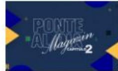
Ponte al Maqazin capítulo 2