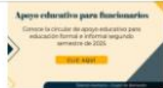
Apoyo educativo para educación formal e informal, segundo semestre de 2025

A continuación, algunas imágenes de las jornadas realizadas en el Centro Facilitador de Servicios de Migración - Cali y en los procesos de la entidad.